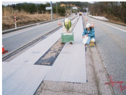
クラック抑制シート出来形確認