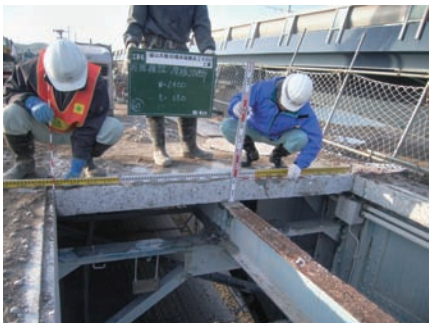
床版切斷桁高確認