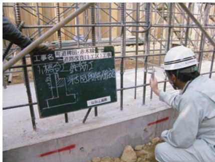
下部工鉄筋工確認