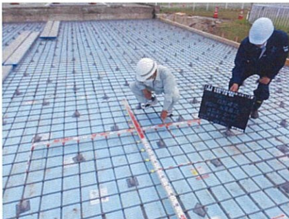
コンクリート床版筋確認