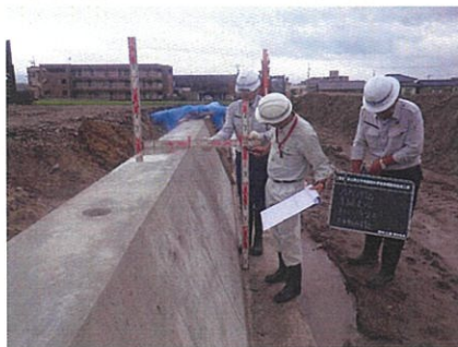
擁壁工出来形確認