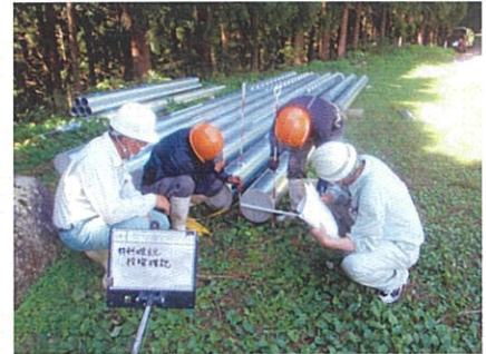
落石防護柵材料確認