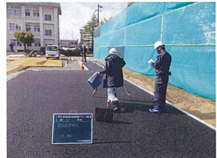
グラウンド舗装工基準高確認