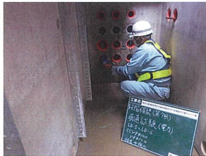
電力配管導通試験確認