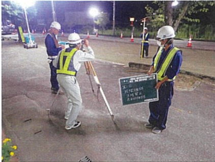
舗装工基準高確認

.....主な社会資本整備支援事業..... 県・市町村等地方公共団体が実施する公共事業の設計積算・施工管理等の業務を支援しています。