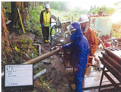
集排水ボ-リング 工施工状況確認