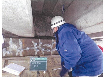
ひび割れ補修工施工状況確認