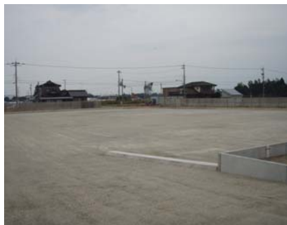
駐車場予定地の状況