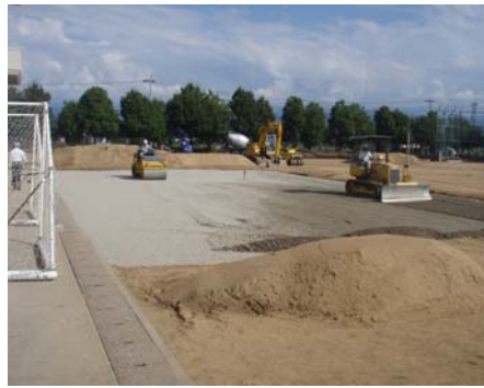
路盤の施工状況（部分的に施工）

センターでは、測量設計及び工事に関する設計積算・工事管理を受託しました。改修工法は県内で実績もある現状土に樹皮繊維を混合して攪拌・転圧する工法を採用し、低コストで高い効果を得られるように努めました。