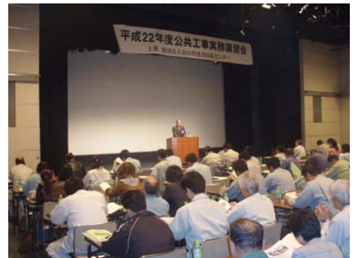
H22. 4. 21 公共工事实務講習会 (高岡会場)