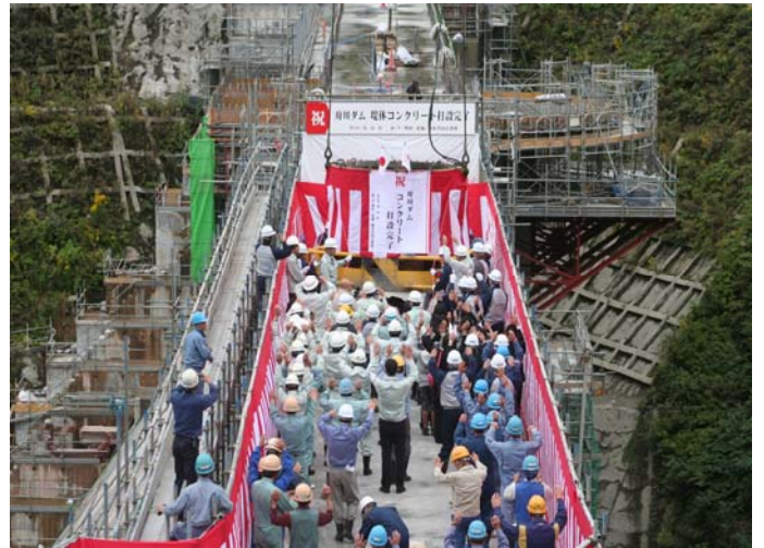
舟川ダム 堤体コンクリート打設完了 H22. 10. 22

平成 20 年 10 月に着工した堤体工が、このほど平成 22 年 10 月の本体コンクリート最終打設をもって、無事完了し、最終打設式が執り行われました。工事関係者他、多くの列席者立会いのもと、完了を祝いました。