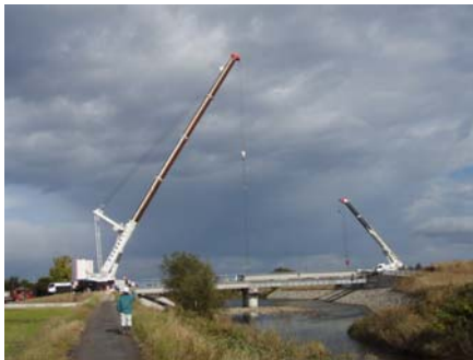
桁架設状況（500t吊りクレーンでの架設）

この工事は、富山市中心街と上市町を結ぶ新設道路で、「立山・上市横断道路」の白岩川にかかる橋梁の新設工事です。橋梁はプレテンション2径間連結T桁橋であり、平成20年度に橋脚1基、翌21年度に橋台2基を完了し、今年度は上部施工したものです。上部工の施工にあたり、500t吊りクレーンの採用など、効率的な施工に留意しました。