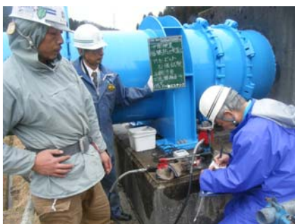
アンカボルト引張試験（中間検査）