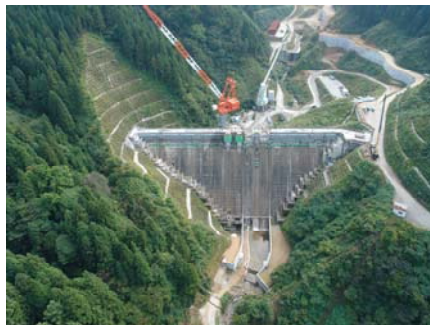
堤体完了後(下流側)