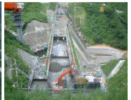
堤体完了後(右岸側)