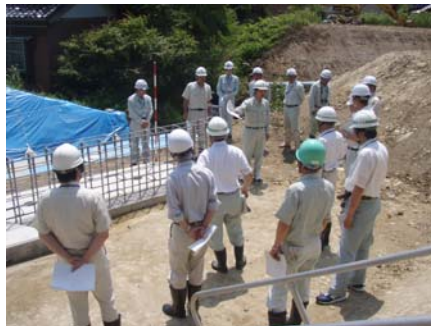
H22. 6. 17 市町村技術職員研修 (実地検査)