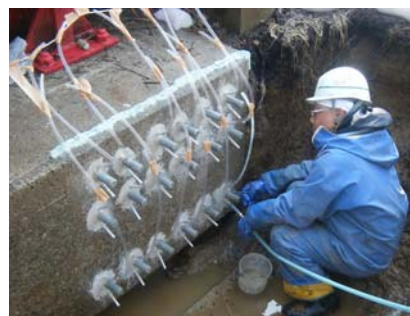
アンカ及び定着材注入（橋軸直角方向）