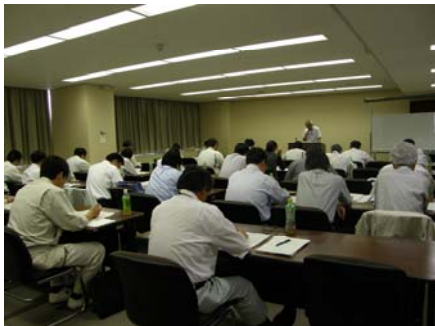
H22. 6. 9 市町村技術職員研修 (検査技術)