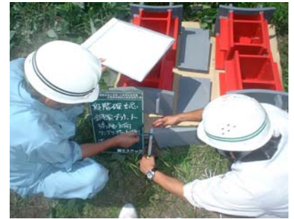
材片寸法検収（段階確認）