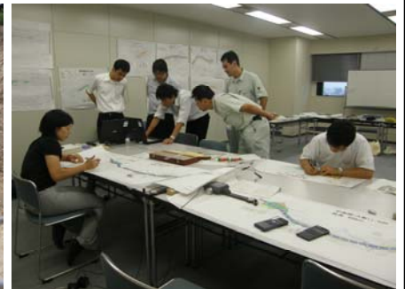
H22 県土木部新採職員研修