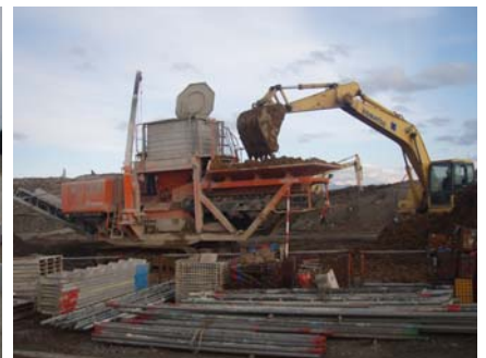
リテラによる地盤改良