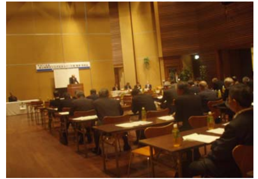
H22. 11. 11 防災シニアエキスパート研修会