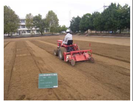
樹皮繊維の攪拌状況