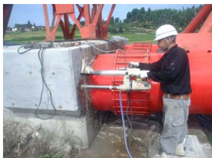
削孔状況（橋軸方向）

この工事は、県企業局が管理する上水道及び工業用水道の水管橋において、地震時における耐震性の向上と水道供給機能の安定化を図ることを目的として落橋防止装置を設置するものです。既設橋台において十分な鉄筋探査を行った後、アンカボルトを橋軸、及び橋軸直角方向に設置、更にPCケーブルや鋼材プレート等を固定することにより、水管橋の耐震化を図るものです。