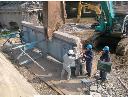
撤去桁長確認 富山大橋旧橋撤去工 工事 発注者:富山県富山土木センター 〔設計積算・施工管理・技術審査支援〕

.....主な社会資本整備支援事業..... 県・市町村等地方公共団体が実施する公共事業の設計積算・施工管理等の業務を支援しています。