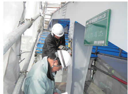
塗装膜厚確認 神通大橋塗装塗替工 工事 発注者:富山市建設部 〔施工管理〕