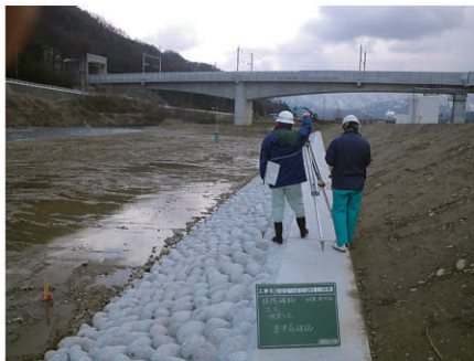
埋戻工出来形確認 布施川河川改修護岸工 工事 発注者:富山県新川土木センター 〔設計積算・施工管理〕