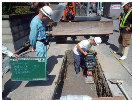
管渠埋戻し状況確認 立山特環汚水幹線管渠工 工事 発注者:中新川広域行政事務組合 〔設計積算・施工管理〕