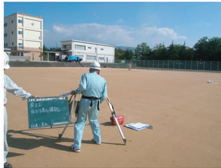
客土工仕上がり高確認 富山高等支援学校グラウンド整備工 工事 発注者:富山県教育委員会 〔設計積算・施工管理〕