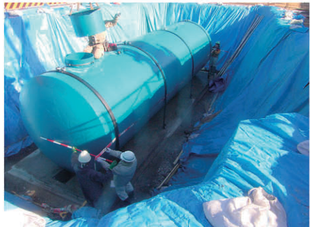
材料検収 防火水槽新設工 工事 発注者:富山市消防局 〔設計積算・施工管理〕