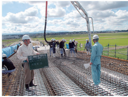
コンクリート打設状況確認 針原跨線橋(仮称)上部工 工事 発注者:富山県高岡土木センター 〔施工管理〕