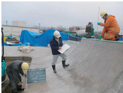
遊戯施設工(バンク工)出来形確認 (仮称)富山市スポーツパーク整備工 工事 発注者:富山市市民生活部 〔施工管理〕