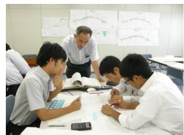
県土木部隣府職員研修(グループ討議)