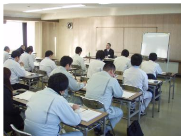
市町村技術職員研修(講師派遣)