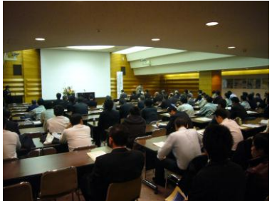
「とやま土木の日」記念講演会