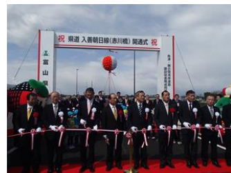
県道入善朝日線赤川橋 開通式