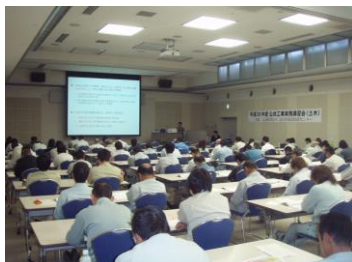
公共工事実務講習会(土木:入善会場)