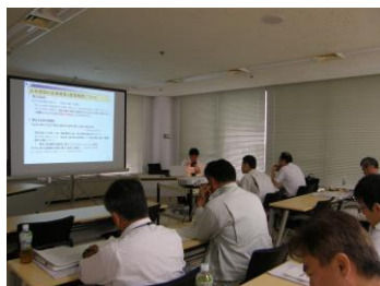
市町村技術職員研修(検査技術)