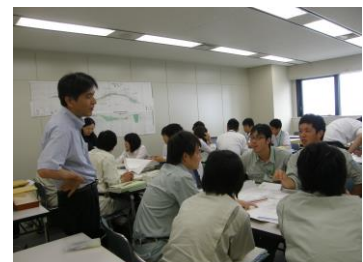
県土木部初級研修