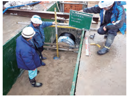
上水管路敷設高確認 水道用供水管更新工事(氷見線) 発注者：企業局 〔施工管理〕