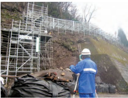
支柱設置位置確認 (主) 富山上滝山線落石防護柵設置工事 発注者：富山県富山土木センター 〔施工管理〕