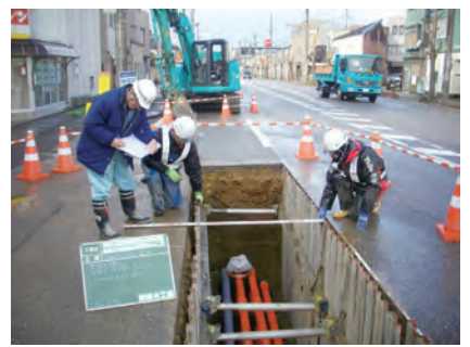
管路設置状況確認 (都) 高岡駅佐加野線電線共同溝工事 発注者：富山県高岡土木センター 〔施工管理〕