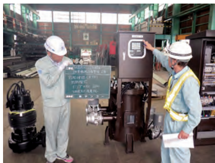
消雪操作盤、ポンプ製品確認 村道役場仏生寺線外消雪機械設備整備工事 発注者：舟橋村 〔設計積算・施工管理〕