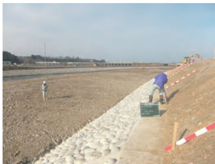
埋戻工出来形確認 布施川河川改修護岸工工事 発注者：富山県新川土木センター 〔設計積算・施工管理〕