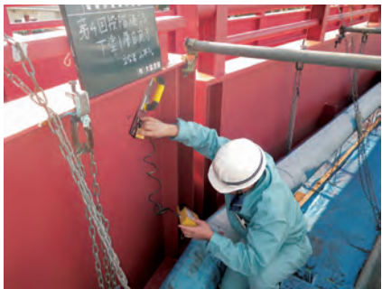
塗装膜厚確認 (一) 才川七城端線城南歩道橋再塗装工事 発注者：富山県砺波土木センター 〔施工管理〕