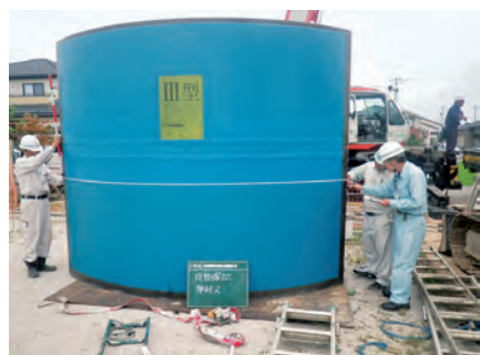
防火水槽材料検収 防火水槽新設工事 発注者：富山市消防局 〔設計積算・施工管理〕