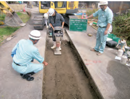
管渠埋戻し状況確認 立山特環汚水枝線管渠工事 発注者：中新川広域行政事務組合 〔設計積算・施工管理〕