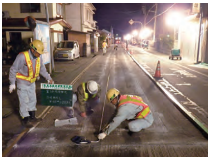
路面切削確認 県管理道路舗装補修工事 発注者：富山県富山土木センター 〔設計積算・施工管理〕

.....主な社会資本整備支援事業..... 県・市町村等地方公共団体が実施する公共事業の設計積算・施工管理等の業務を支援しています。