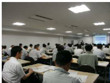
市町村技術職員研修（検査技術）