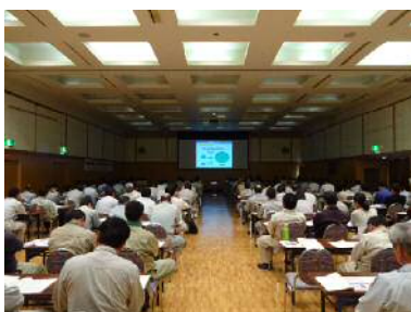
公共工事实務講習会(土木：南砺会場)