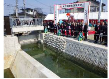
沖田川放水水路完成記念式典