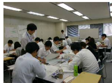
県土木部初級研修