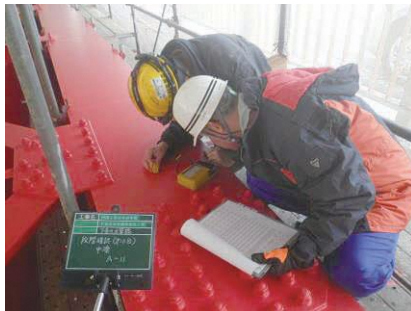
水管橋塗膜厚確認 工業用水道水管橋再塗装工事 発注者：富山県企業局 〔施工管理〕