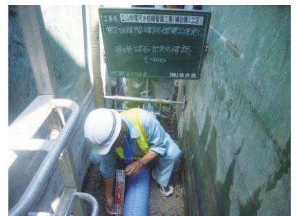
管渠工基礎碎石厚確認 立山特環汚水枝線管渠工事 発注者：中新川広域行政事務組合 〔設計積算・施工管理〕