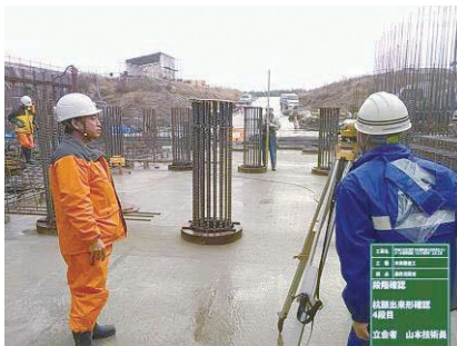
杭頭出来形確認 神通川左岸浄化センター水処理施設工事 発注者：富山県高岡土木センター 〔施工管理〕