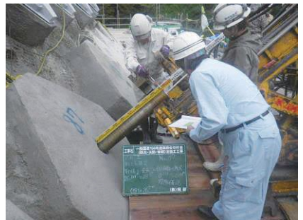
アンカー工削孔長確認 (国) 156号 法面工工事 発注者：富山県砺波土木センター 〔施工管理〕