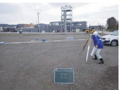
路盤工基準高確認 呉羽保育所敷地造成工事 発注者：富山市 〔設計積算・施工管理〕