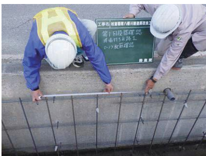
現場打ち水路工配筋確認 村道稲荷八幡川線道路改良工事 発注者：舟橋村 〔設計積算・施工管理〕