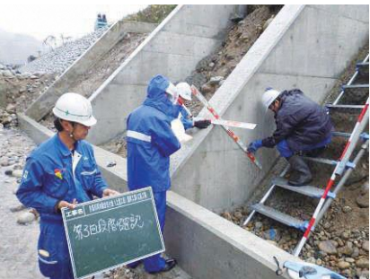
隔壁工出来形確認 片貝川(上流工区)護岸工事 発注者：富山県新川土木センター 〔施工管理〕