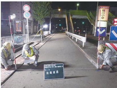
路盤工幅員確認 県管理道路舗装補修工事 発注者：富山県富山土木センター 〔設計積算・施工管理〕

.....主な社会資本整備支援事業..... 県・市町村等地方公共団体が実施する公共事業の設計積算・施工管理等の業務を支援しています。