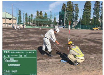
クレー舗装工出来形確認 富山高等学校グラウンド整備工事 発注者：富山県教育委員会 〔設計積算・施工管理〕