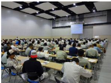
公共工事実務講習会(富山会場)