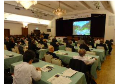
防災シニアエキスパート会 研修会

「水災害分野における Transdisciplinary Approach の重要性」 「自治体の危機管理について」