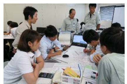
県土木部 初級実務研修