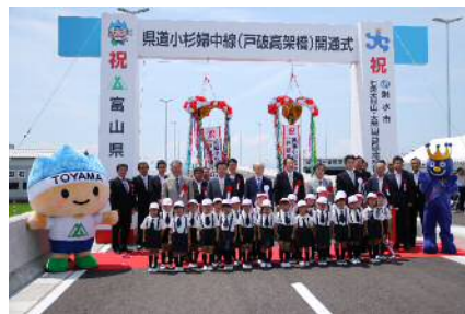
県道小杉婦中線(戸破高架橋)開通式