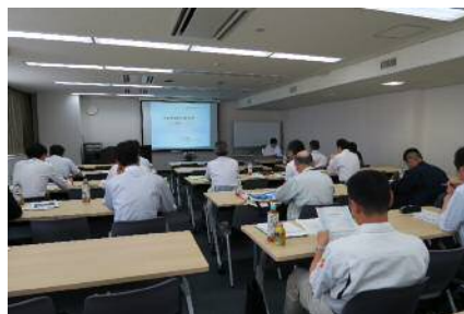
市町村技術職員研修(検査技術)