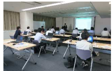
県土木部 初級実務研修