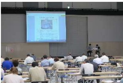
公共工事実務講習会(富山会場)