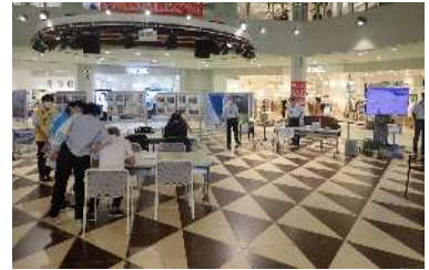
能越自動車道・立山有料道路フェア