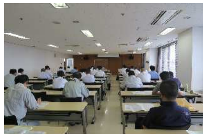
市町村技術職員研修(検査技術)